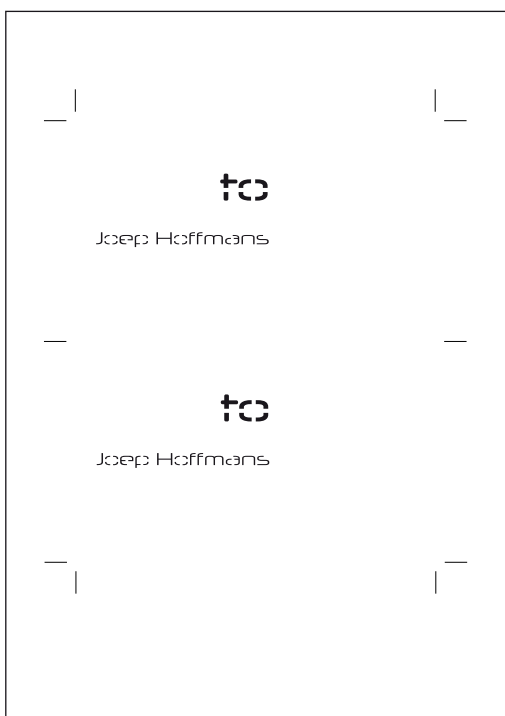
1x document *AI, *EPS, *PDF met ALLEEN de te laser stansen elementen met snijtekens. Positie van deze elementen moet exact zijn ten opzichte van het drukvel. Papier formaat in document moet gelijk zijn aan het papier waarop geprint/gedrukt is. In het document moet het papier zijn aangegeven met een wit vlak zonder lijn.

Point to Paper is niet aansprakelijk voor de door u aangeleverde designs die beschermd worden door Copyright van derden.