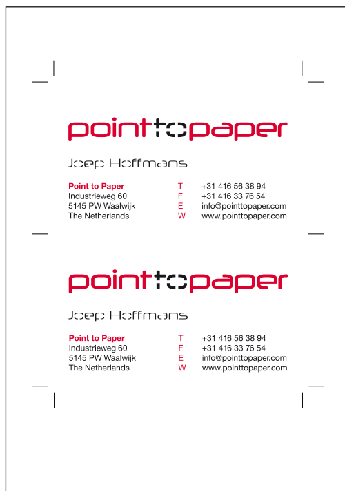
1x document *AI, *EPS, *PDF met totaal beeld inclusief de te laser stansen elementen. Papier formaat in document moet gelijk zijn aan het papier waarop geprint/gedrukt is. Alle markering op snijtekens na weglaten!

Bestanden moeten VECTOR (lijn tekeningen) zijn. Dus geen foto (pixels).