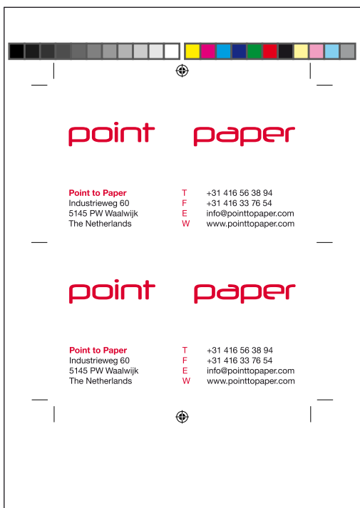
Aangeleverd drukvel voor laser stansen.

bestands formaat van illustrator versie 3.0/3.02 t/m illustrator CS4: